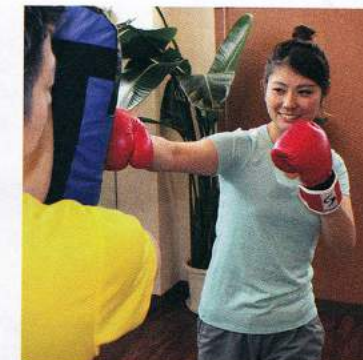
若い女性にも人気のキックエクササイズ