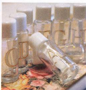
計算されている8種類の香り